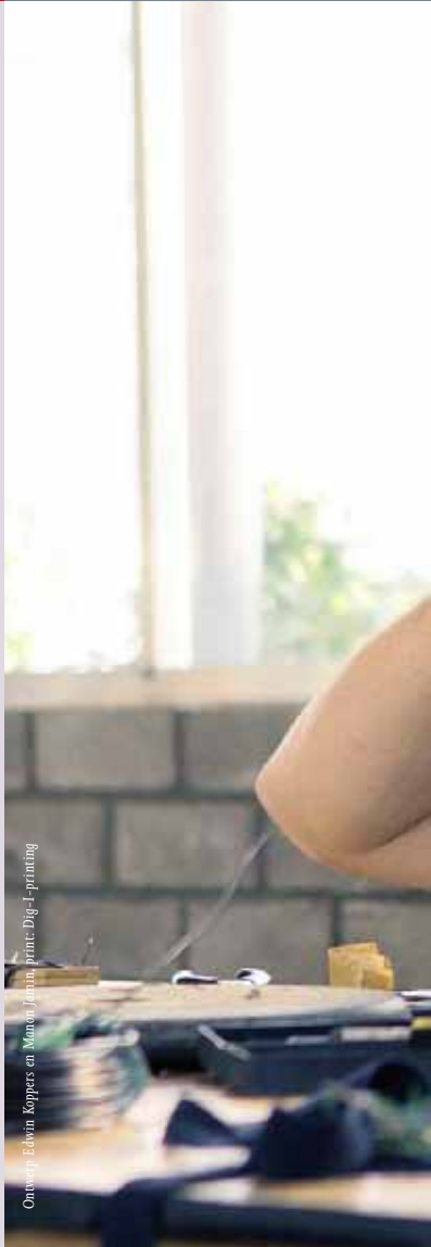
Oruwan, Edwin Koppers en Manon Jansen, print, Dig-1-printing