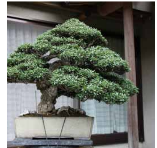
Deze loofboom is ook van een aanzienlijke leeftijd. Naar schatting is deze ook meer dan 100 jaar oud.