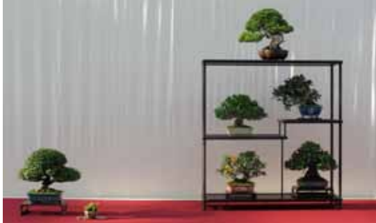
Een aantal voorbeelden van Shohin opstellingen van de EBA 2011