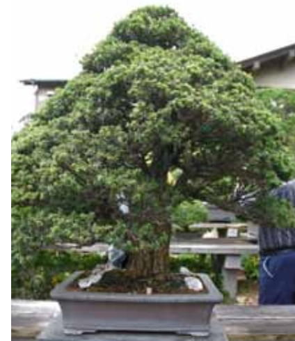
Taxus Cuspidata van zo'n 150 jaar

Volgende bomen staan in dezelfde bonsai tuin als de vorige.